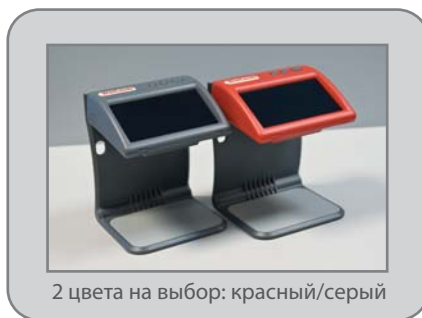
2 цвета на выбор: красный/серый